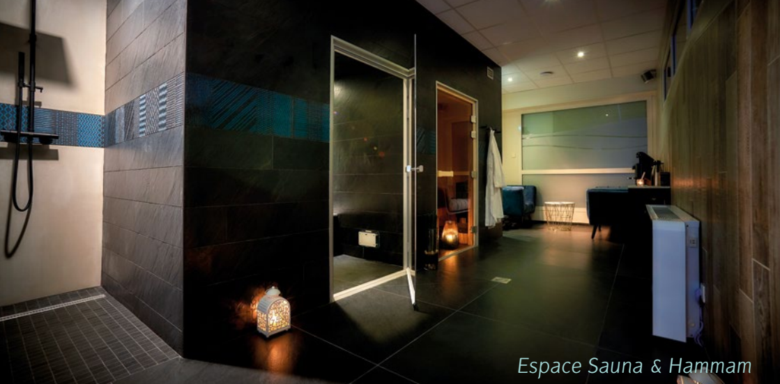
Espace Sauna & Hammam

Ressourcez-vous à l'Espace Spa et découvrez nos univers de soins dédiés au visage et au corps.