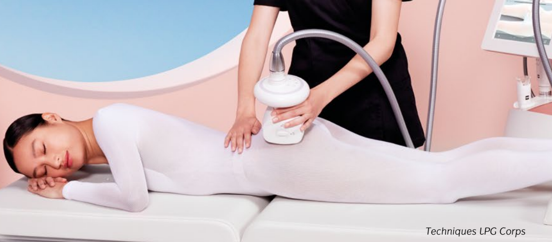
Techniques LPG Corps